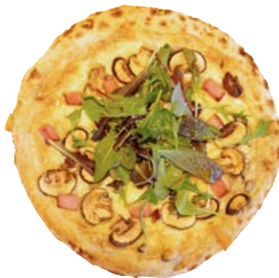
香取市産マッシュルームと ベーコンのピザ 【クリームベース】

香取市産の新鮮な生乳から作った伊能忠次郎商店のモッツァレラチーズを使用。 非加熱製法だからこそその生乳本来の ミルキーな風味をお楽しみください。