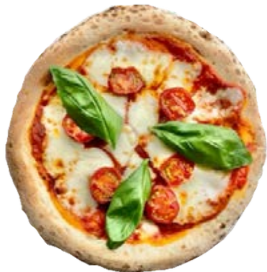
香取市産モッツァレラの マルゲリータ