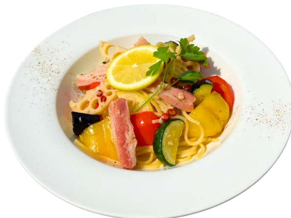
レモン香る野菜とベーコンの ペペロンチーノ

新玉ねぎの甘さが感じられるのは今だけ。 そのシャキシャキ感と桜海老の風味が たっぷり絡んだ春を感じる一品。