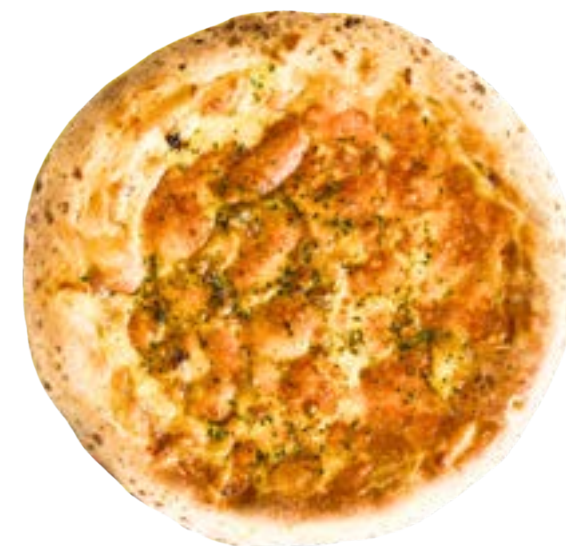
四種のチーズとハチミツのピザ 【チーズベース】

ポルチーニ香るホワイトソースに 香取市産マッシュルームを ふんだんに使い仕上げました。 是非お召し上がり下さい。