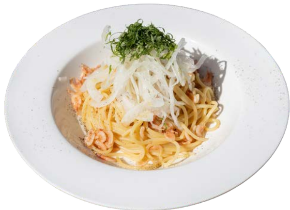
新玉ねぎと桜海老の和風パスタ ～青紫蘇をのせて～