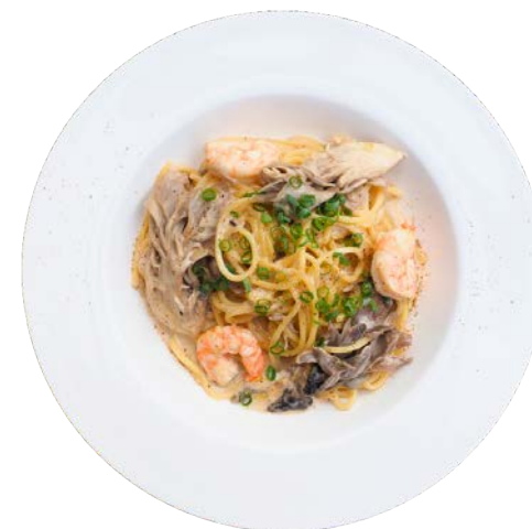
香取市産 舞茸とハーブシュリンプの 和風クリームパスタ

厚切りベーコンと彩り野菜をふんだんに使用しました。 爽やかなレモンの香りと風味豊かなガーリックは 相性抜群！食欲をそそられる一品です。